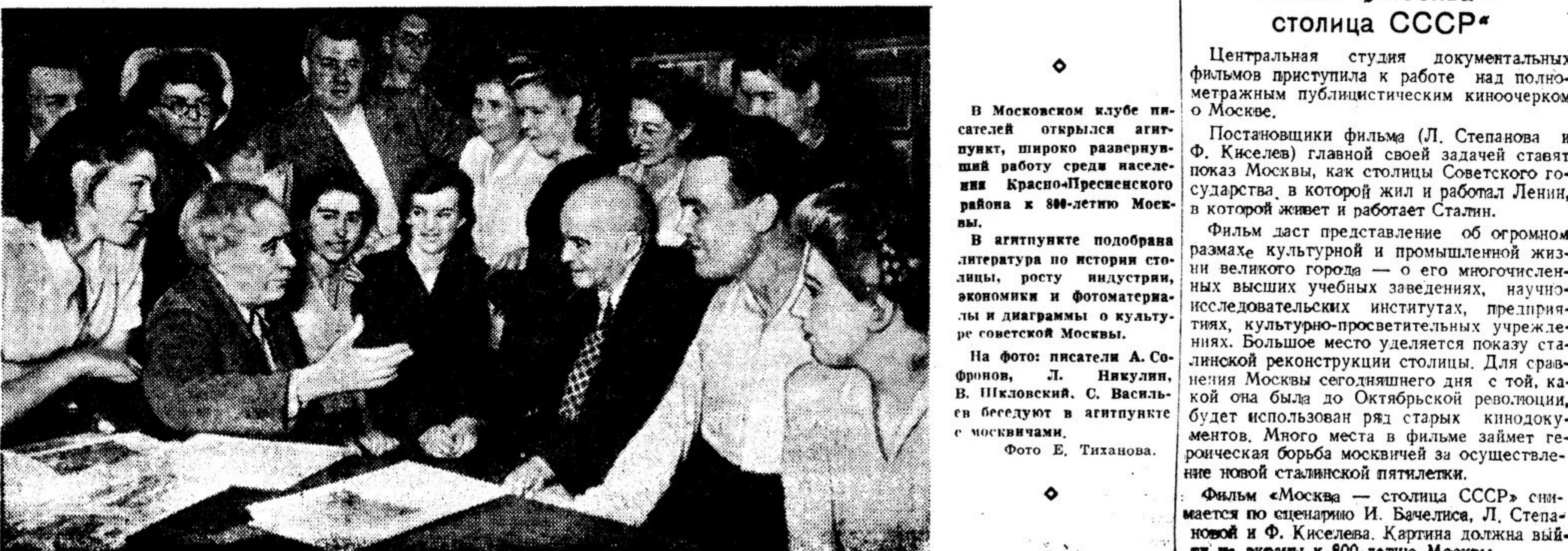
В Московском клубе писателей открылся агитпункт, широко развернувший работу среди населения Красно-Пресненского района к 800-летию Москвы.

Фильм «Москва — столица СССР» снимается по сценарию И. Бачелия, Л. Степановой и Ф. Киселева. Картина должна выйти на экраны к 800-летию Москвы.