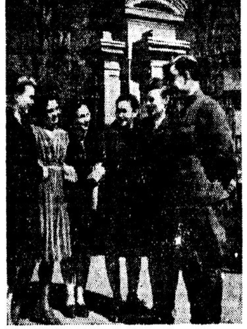
Педагогические и учительские институты Белорусской ССР выпустили в этом году около 1000 специалистов народного образования...