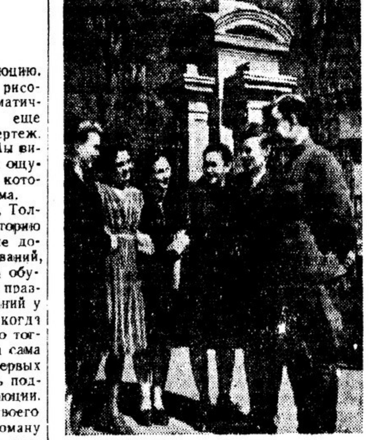
Педагогические и учительские институты Белорусской ССР выпустили в этом году около 1000 специалистов народного образования...